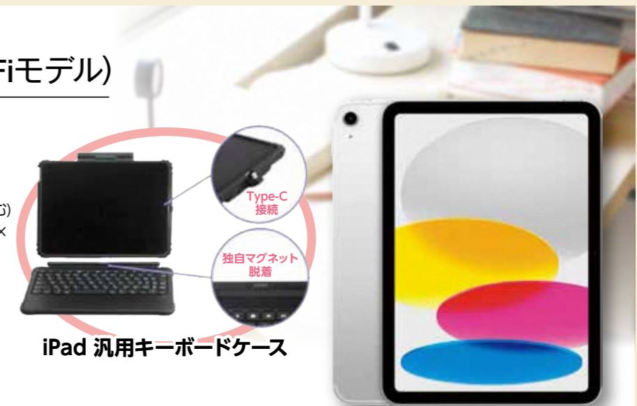
iPad 汎用キーボードケース

※イエロー・ピンクは端末販売ストアのみとなります。 (数に限りがございます。) ※スタイラスペンは付属いたしません。